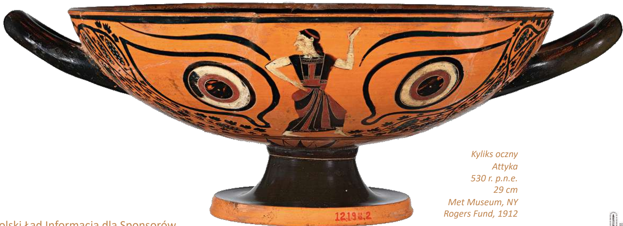
Kylix oczny Attyka 530 r. p.n.e. 29 cm

Sponsoring muzeum to wyjątkowy sposób na zwiększenie widoczności firmy, budowanie marki, kształtowanie wizerunku, bezpośredni kontakt z potencjalnymi klientami przy jednoczesnym wsparciu społeczności. Działania te są wyjątkowo skuteczne. Dzięki uldze sponsoringowej podatnik, oprócz zaliczenia poniesionych kosztów w 100 proc. do kosztów uzyskania przychodu, uzyskuje prawo do dodatkowej preferencji w podatku dochodowym przez odliczenie od podstawy opodatkowania 50 proc. poniesionych kosztów. Łącznie w podatku dochodowym przedsiębiorca rozlicza więc 150 proc. poniesionego kosztu!