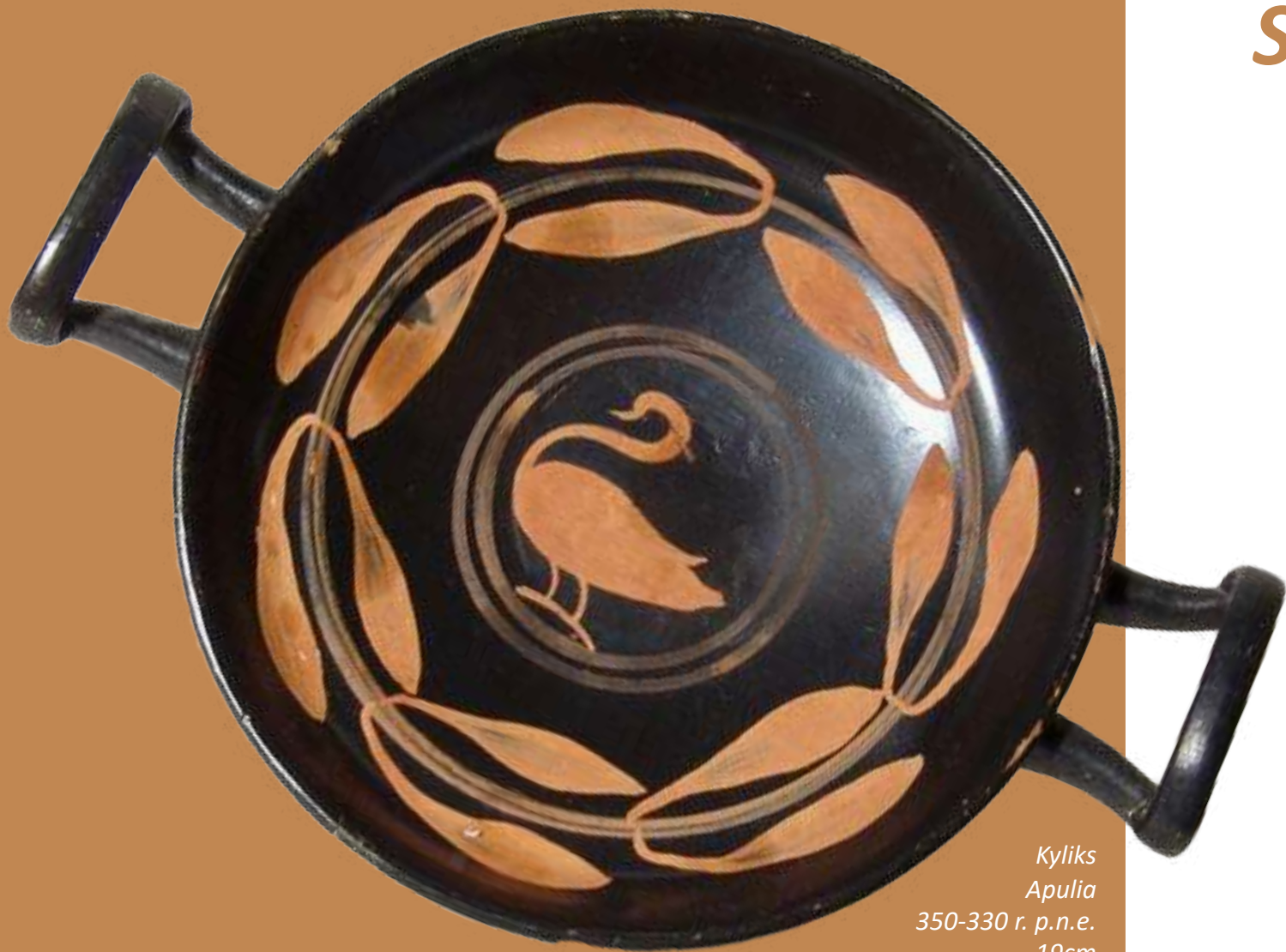
Kylix Apulia 350-330 r. p.n.e. 19cm PRIMA PORTA