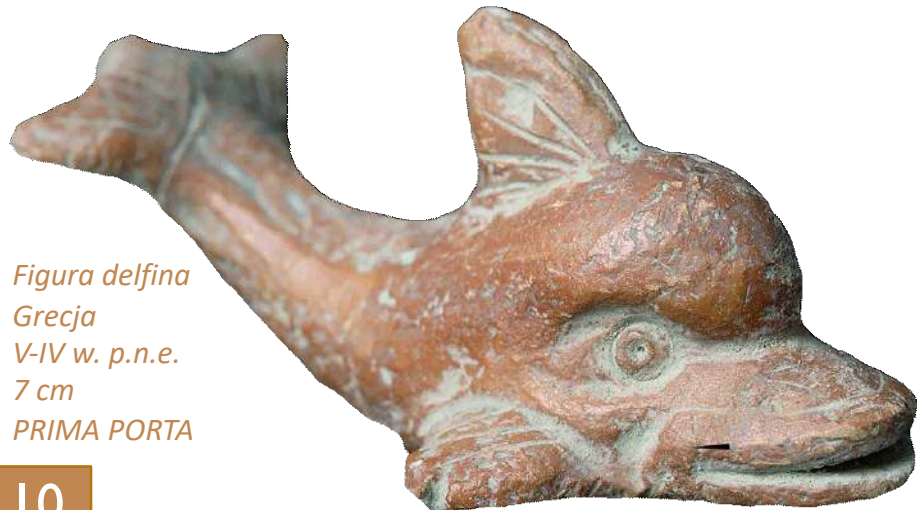
Figura delfina Grecja V-IV w. p.n.e. 7 cm PRIMA PORTA

To co składa się na wspaniałą kolekcję to umiejętność wyodrębnienia kilku dzieł, a następnie wyeksponowania i łączenia ich w taki sposób, aby zwiększyć i pogłębić nasze rozumienie tego konkretnego nurtu sztuki lub historii i ewolucji sztuki w ogóle. W każdej dojrzałej kolekcji całość jest warta znacznie więcej niż suma jej poszczególnych elementów.