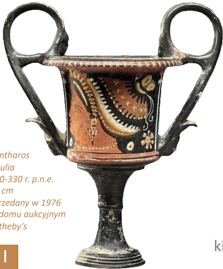
Kantharos Apulia 350-330 r. p.n.e. 24 cm sprzedany w 1976 w domu aukcyjnym Sotheby's

Od prawie 175 lat dzięki nieustannemu zaangażowaniu społeczności Muzeum Archeologiczne w Krakowie realizuje swoją wizję. Weź udział w powołaniu do życia kolekcji złożonej z artefaktów mających ponad 4000 lat i skorzystaj przy tym z ulgi podatkowej, a jednocześnie dzięki partnerstwu z muzeum realizuj swoje cele marketingowe!