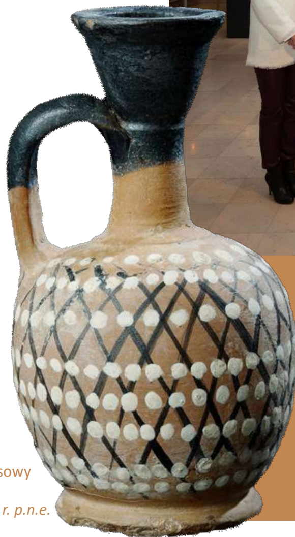
Lekyt aryballosowy Apulia 350-330 r. p.n.e. 9,5 cm