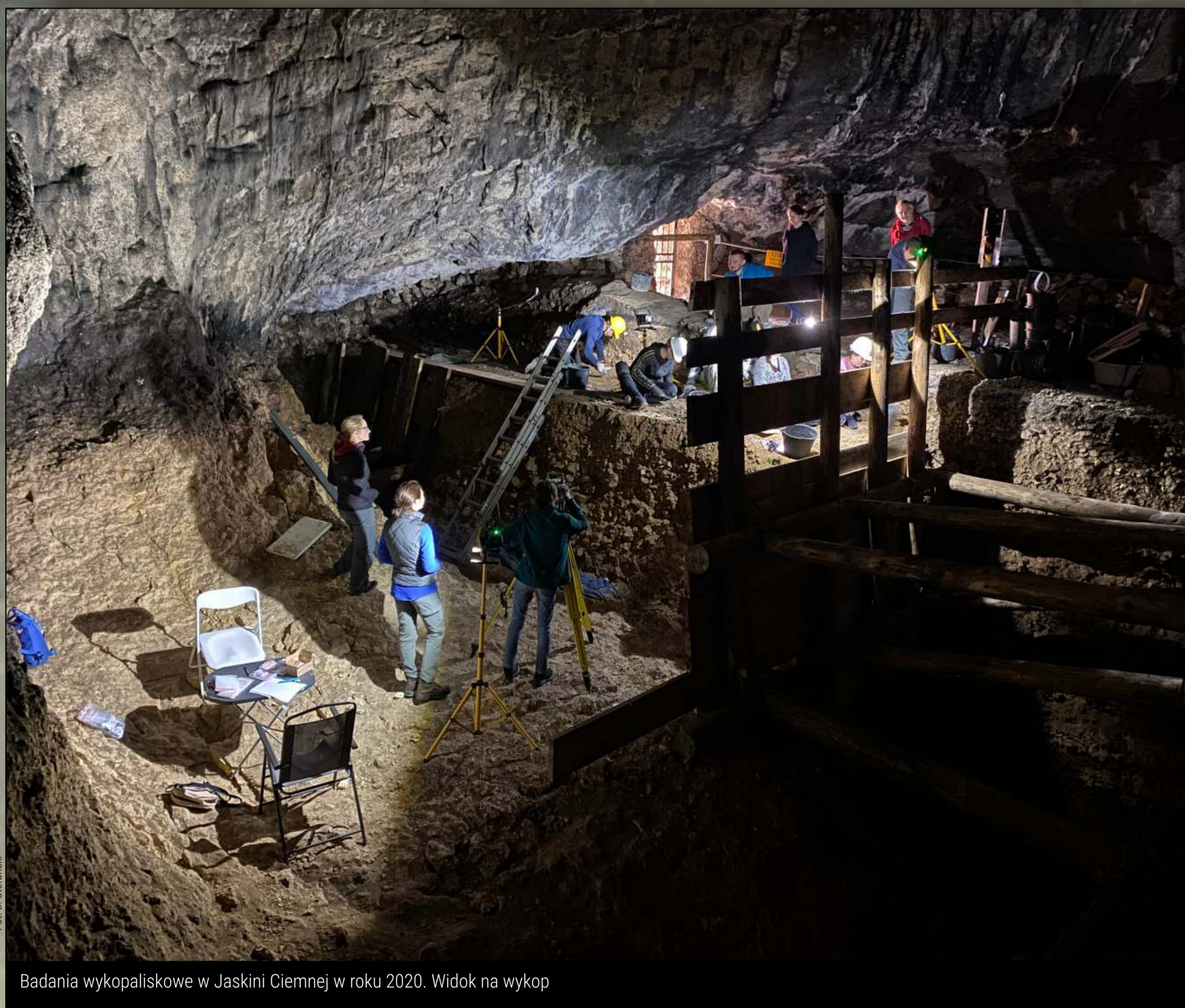
Badania wykopaliskowe w Jaskini Ciemnej w roku 2020. Widok na wykop

The Ciemna Cave is one of the most important Middle Paleolithic sites in Poland. It has been explored from the beginning of 20th century focusing mostly on the outer part of the cave system (Ogrójec). The new project started in 2007 intending to research the inner part of the cave (Main Chamber). During excavation, the rocky floor of the cave was reached revealing a few levels documenting the presence of Neanderthals in the cave. Younger periods (from Neolithic to Middle Ages) were recorded in the top layers as well.