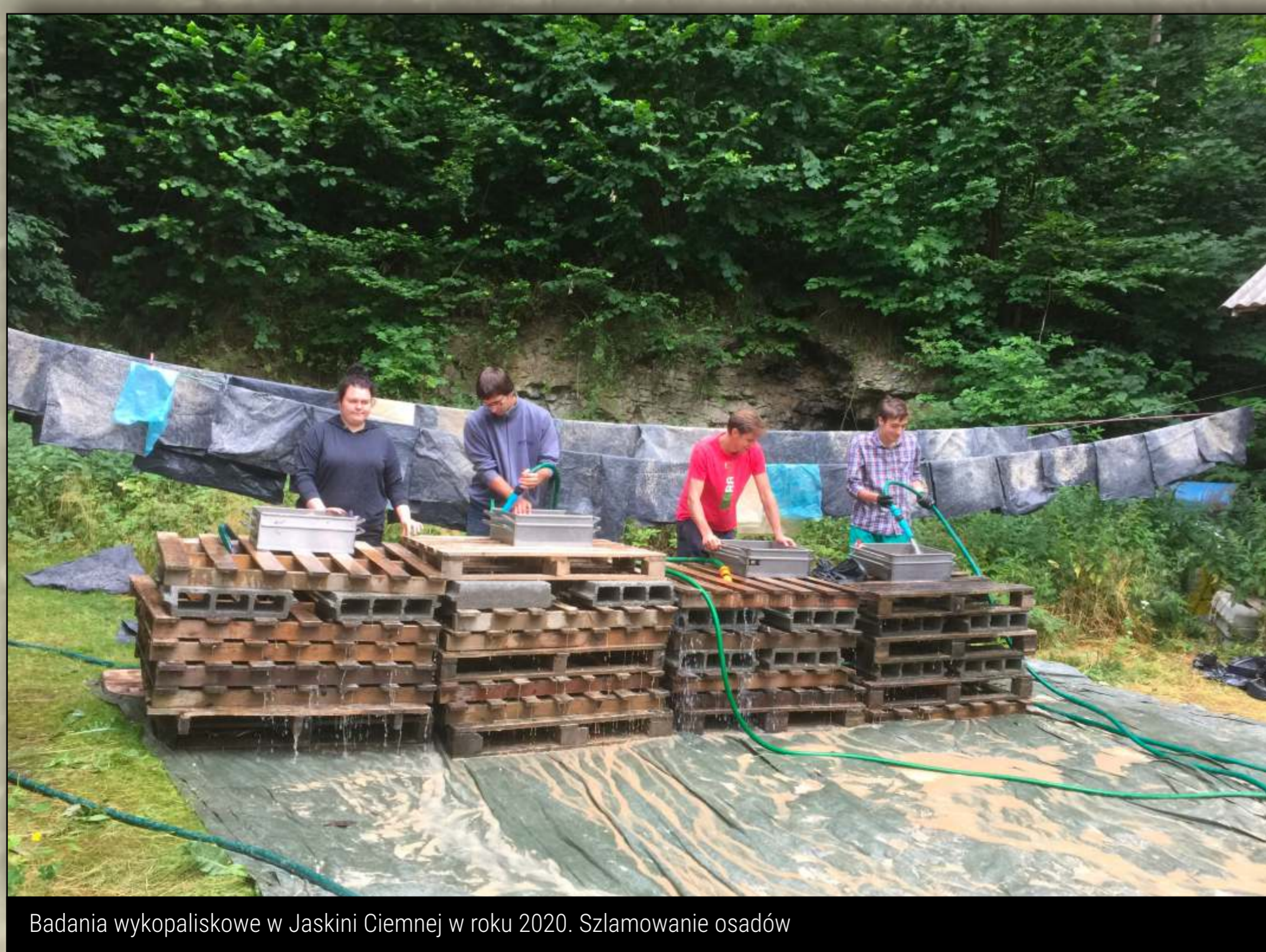
Badania wykopaliskowe w Jaskini Ciemnej w roku 2020. Szlamowanie osadów

Dwa kolejne poziomy (poziomu VIII i VII), z zabytkami charakterystycznymi dla kultury lewaluasko-mustierskiej, pochodzą z okresu interglacjału eemskiego (ciepłego okresu rozdzielającego zlodowacenia), tj. 125 000 – 115 000 lat przed Chr. Na początkową fazę ostatniego zlodowacenia datowany jest poziom zawierający materiały kultury taubaskiej (poziom VI). Trzy kolejne poziomy łączone są z kulturą mikocką (poziomy V-IV), najmłodszy z nich datowany jest na okres ocieplenia pomiędzy dwoma pleniglacjałami ostatniego zlodowacenia, nieco ponad 50 000 lat przed Chr. Oprócz zabytków krzemiennych i kamiennych z badań pochodzi bardzo liczna seria kości fauny, wśród których dominują kości niedźwiedzia jaskiniowego.