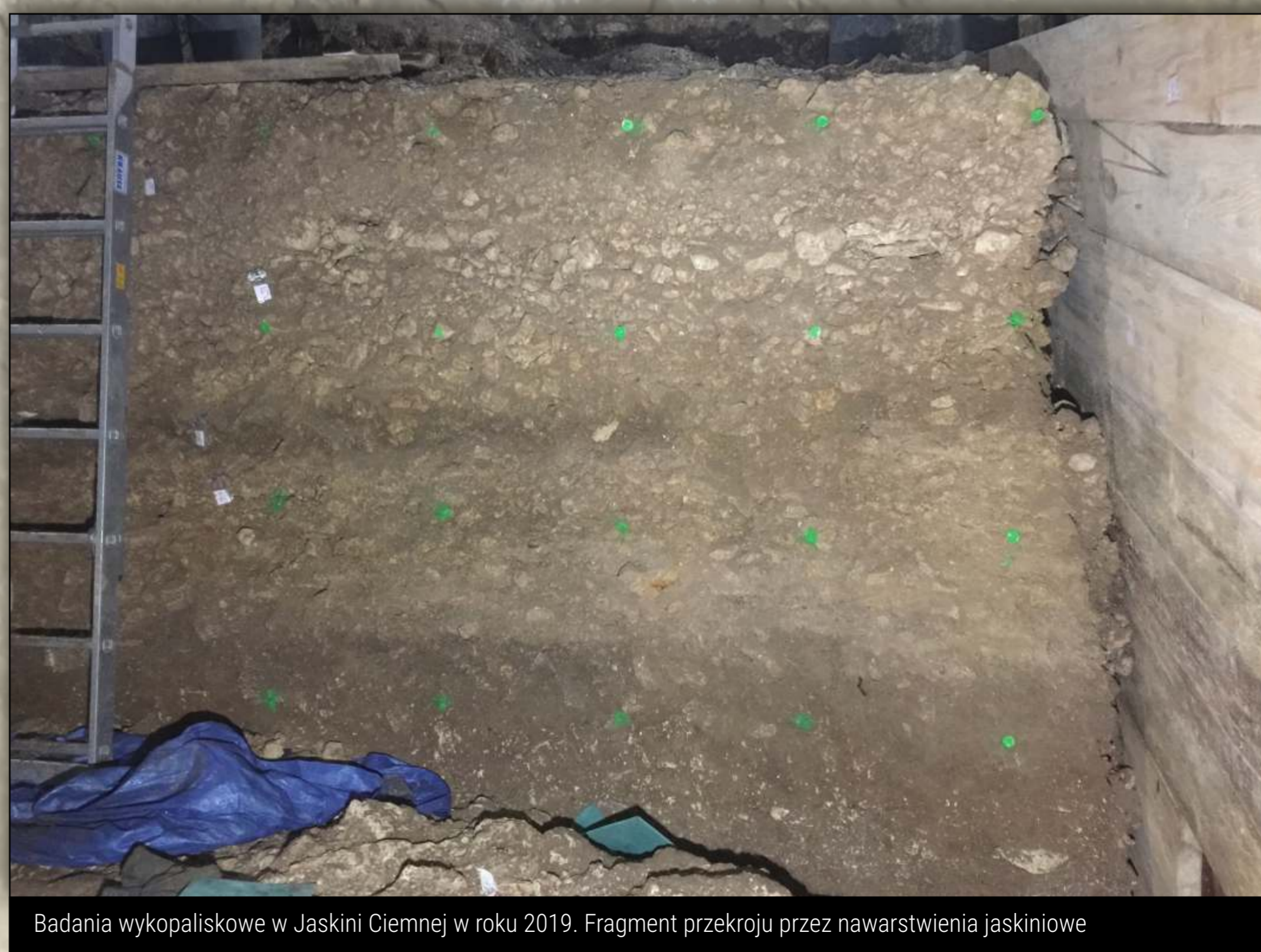
Badania wykopaliskowe w Jaskini Ciemnej w roku 2019. Fragment przekroju przez nawarstwienia jaskiniowe

badania i odkrycia Muzeum Archeologicznego w Krakowie