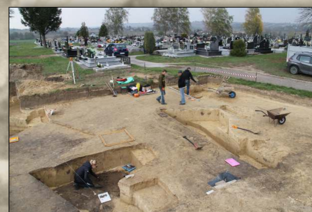
Cmentarzysko na cmentarzu. Eksploracja grobów niszowych sprzed 4,5 tys. lat