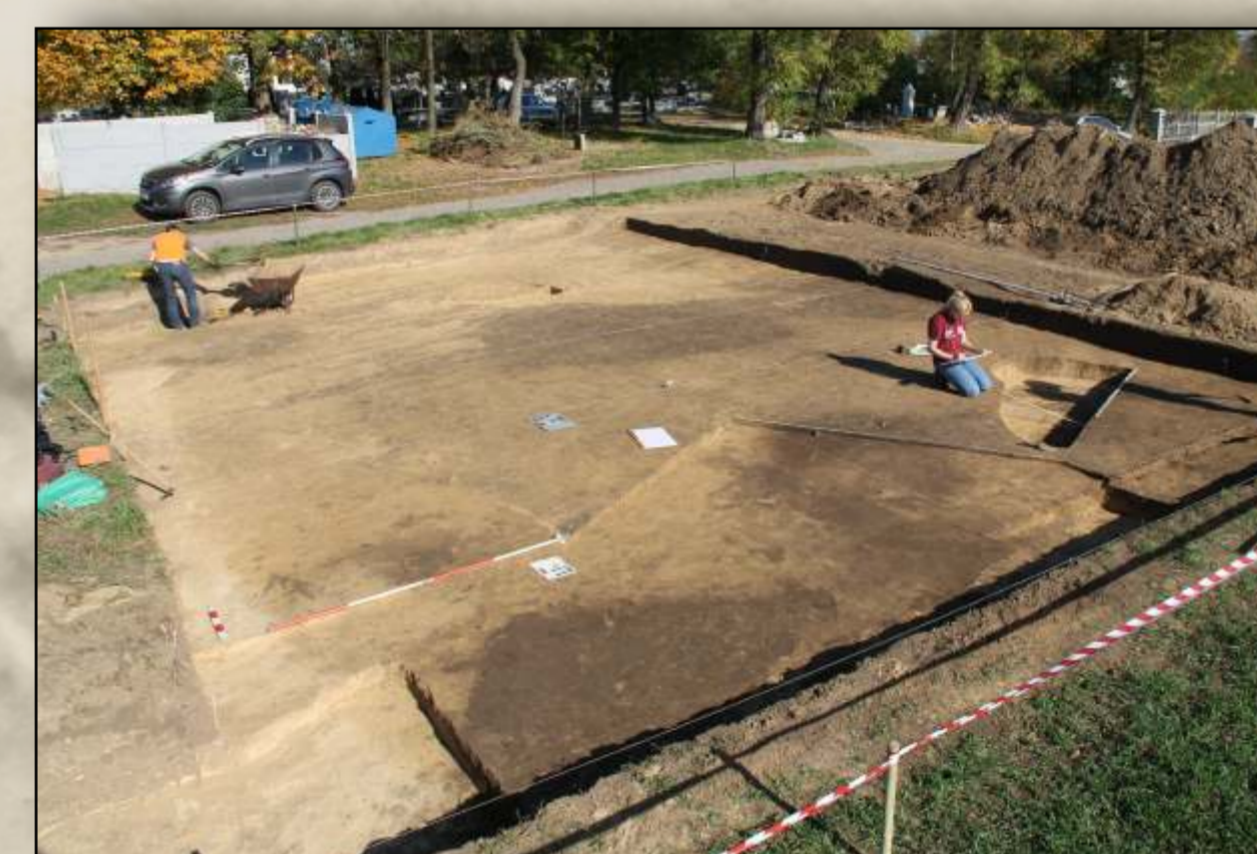
Wykopaliska w 2019 r. Zarysy obiektów grobowych poniżej warstwy ziemi ornej