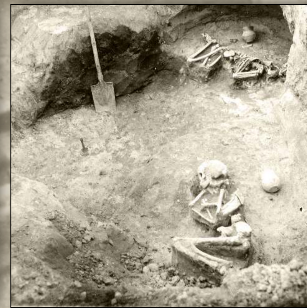
Szkielety z grobów kultury ceramiki sznurowej nr 46/7 i 46/8, odkryte w 1924 r. przez J. Żurowskiego.