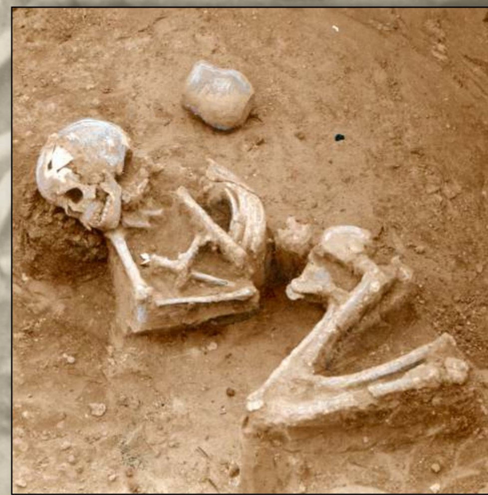
Szkielet ludzki z grobu kultury ceramiki sznurowej nr 46/7, odkryty w 1924 r. przez J. Żurowskiego