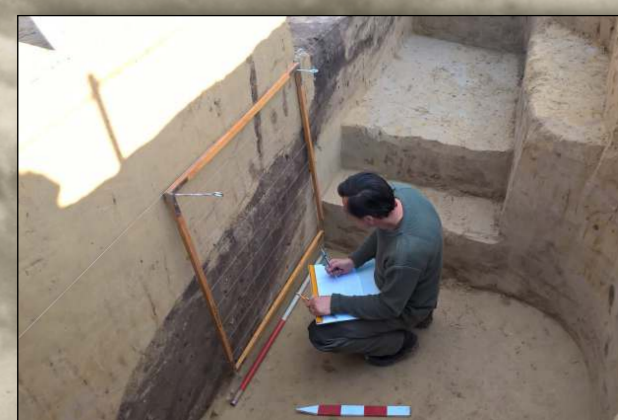
Dokumentacja wypetniska niszy grobowej (ob. 34)