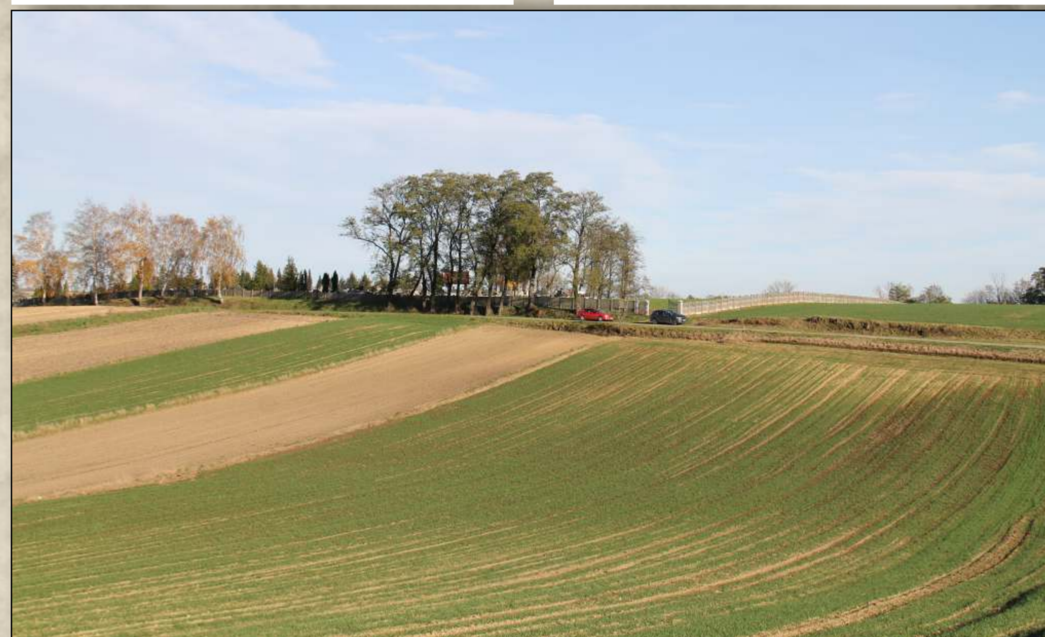
Widok na stanowisko i cmentarz parafialny w Książnicach Wielkich.